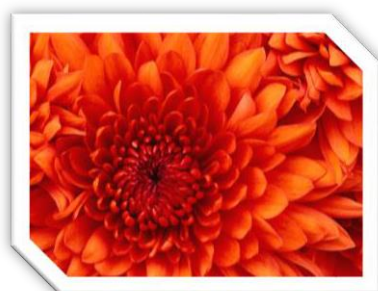
Slika 1: Cvet

(Dodati sliku u tekst, smanjiti je na proizvoljne dimenzije, tako da slika ne prelazi na drugu stranicu. Postaviti stil (okvir) po izboru.)